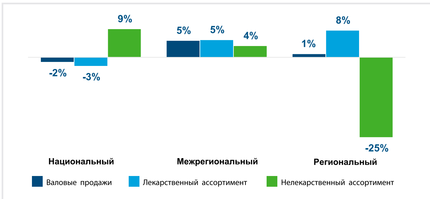
Рисунок составлен на основании данных дистрибьюторов, участвующих в рейтинге

Сравнение прироста товарооборота по ассортименту, 1-2 кв. 2023 года/1-2 кв. 2022 года