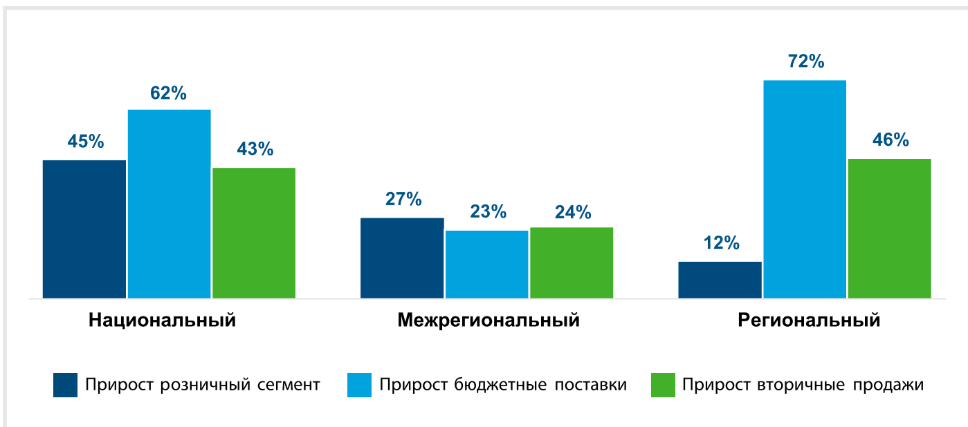
Рисунок составлен на основании данных дистрибьюторов, участвующих в рейтинге

Сравнение прироста объемов продаж по каналам сбыта, 1-2 кв. 2023 года/1-2 кв. 2022 года